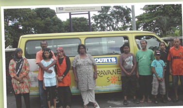
Sortie éducative du groupe Comité Quartier Paix au Frederik Hendrik Museum à vieux Grand Port.