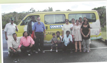
Sortie du groupe 3ème age Eastern Surya Udaye à Alexandra Falls.