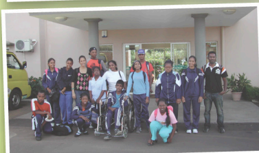
Sortie des enfants du groupe APEIM au gymnase de Trianon pour des activités sportives.