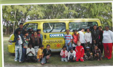
Sortie des enfants du groupe EWAD à la plage de Belle Mare pour des sessions thérapeutiques.